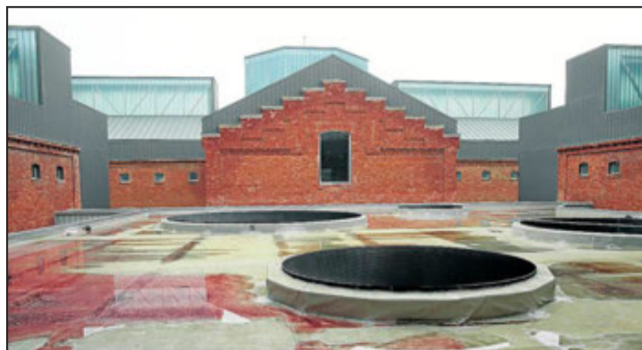
Bolsas de agua en el techo de la antigua prisión.

La cuestión de base es que alguno de los máximos responsables