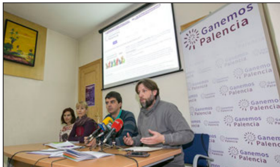
Los cuatro concejales de Ganemos Palencia en rueda de prensa.

• Servicio público de alquiler de bicicletas, sencillo, económico y eficaz. Con posibilidad de pago con tarjeta de crédito y sin darse de alta en ningún sitio, o mediante tarjeta del ayuntamiento para aquellas personas que carezcan de