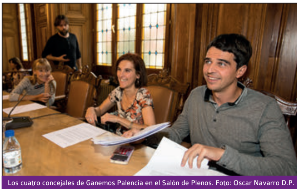
Los cuatro concejales de Ganemos Palencia en el Salón de Plenos.