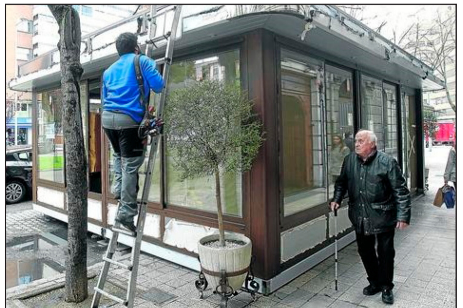
Terraza exterior de 45 m2 de Casa Pepe's.

Consideramos que esa no es la finalidad de dicha terraza y que se está realizando una actuación que bordea la legalidad ya que el interés del hostelero es ampliar su local en un espacio público donde la ordenanza no contempla este tipo de instalaciones. Y generando inconvenientes para el tránsito peatonal y de los autobuses.