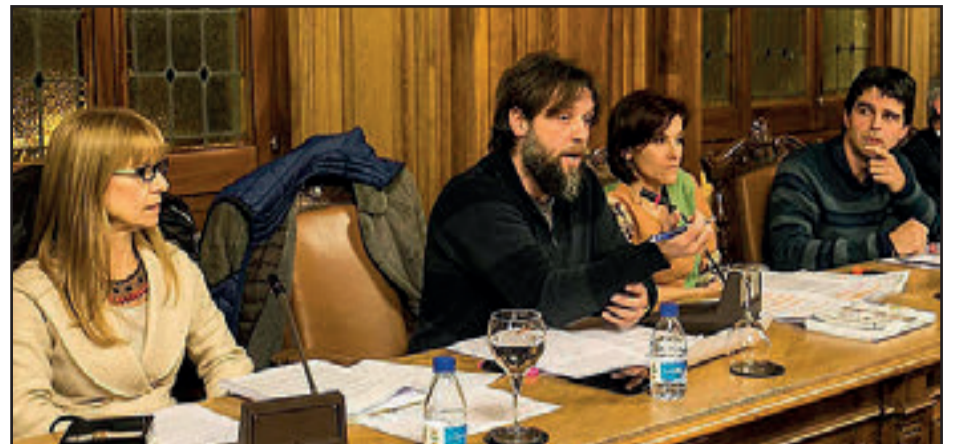
Grupo Municipal de Ganemos Palencia.

Los criterios que la Plataforma Ganemos Palencia establece para poder acceder al apoyo económico se pueden consultar en la web y en resumen son: